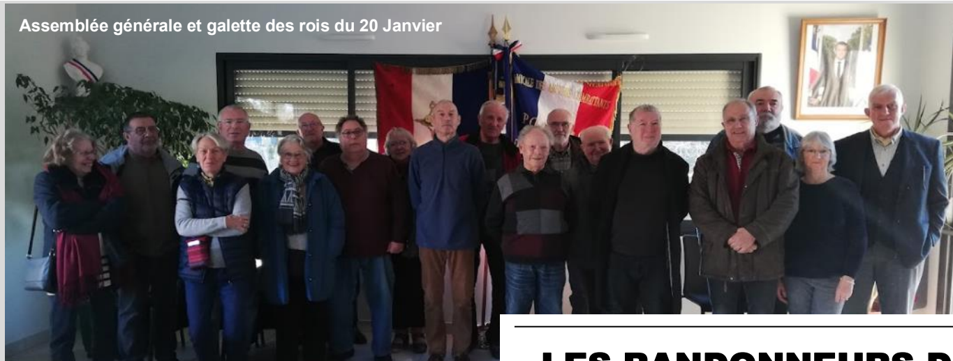
Assemblée générale et galette des rois du 20 Janvier