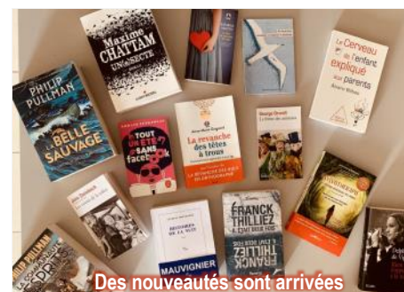
Des nouveautés sont arrivées