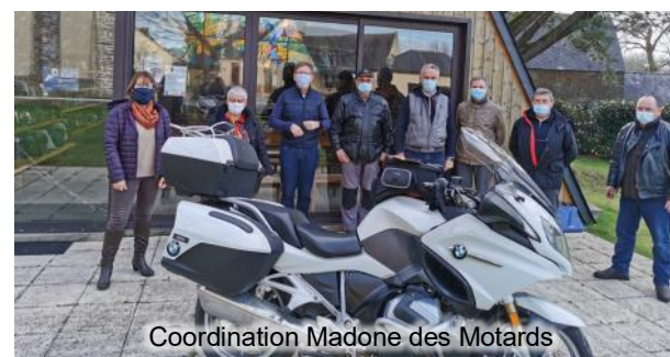
Coordination Madone des Motards

Retrait des commandes de 11h à 18h à la salle de Monteneuf ou de Porcaro.