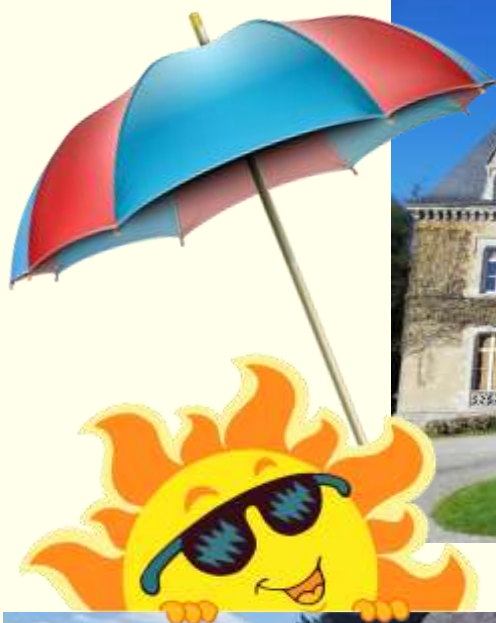
Chasse à l'œuf