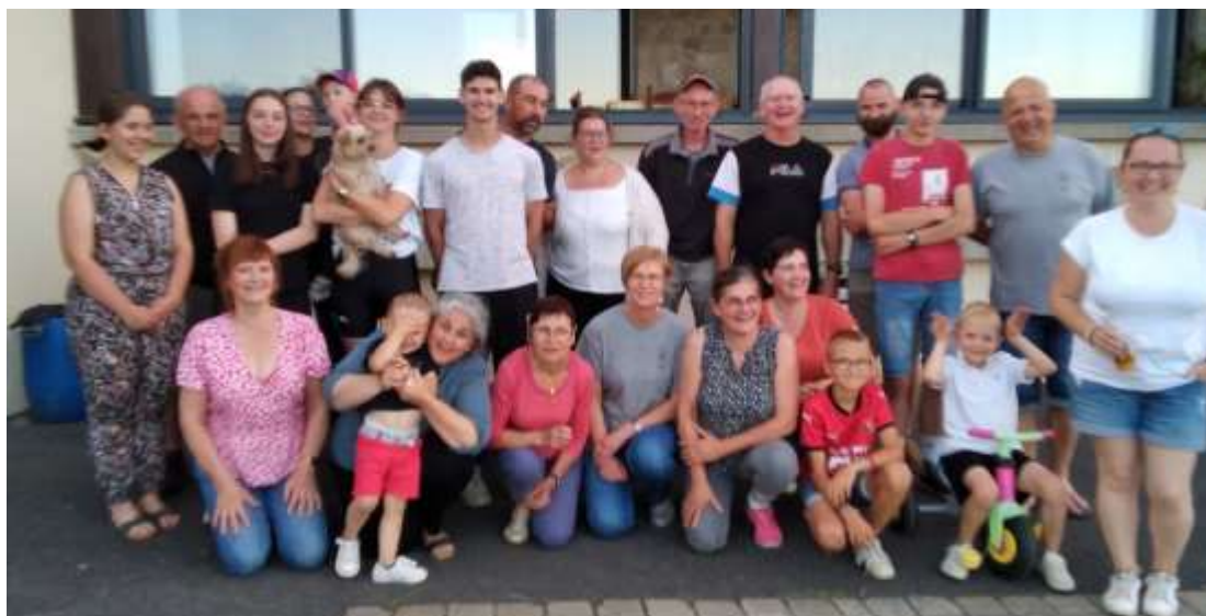
Le Liriot c'est également réuni le 3 Juillet

Pour la 18eme année consécutive, Le pâtis du moulin c'est réuni le 3 juillet, pour leur fête des voisins dans la joie et la bonne humeur .