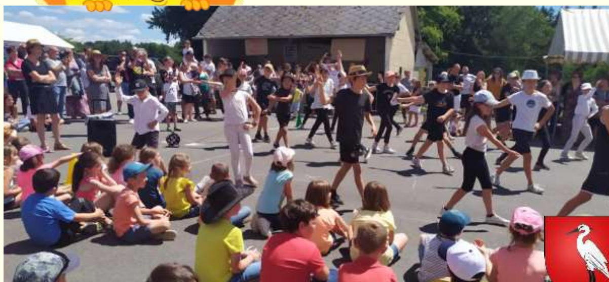
RPI Monteneuf / Porcaro (kermesse)