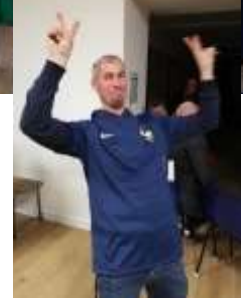
Le Comité Festif - Soirée Apéro