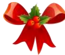
Les Mômes de L'Oyon