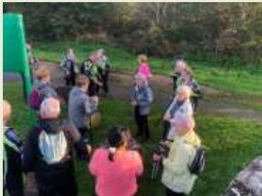
Les randonneurs de l'Oyon