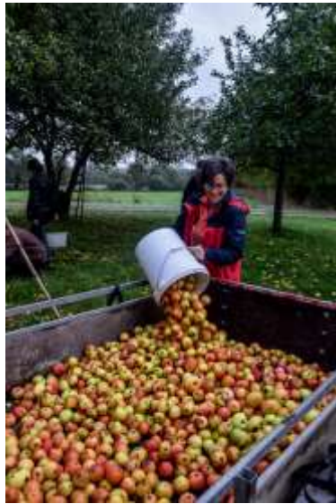
Les Tordus de la Poire