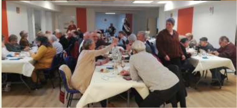
Inauguration de la Priaudais