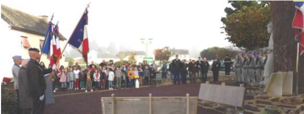
La Sainte Barbe accueillie à Porcaro