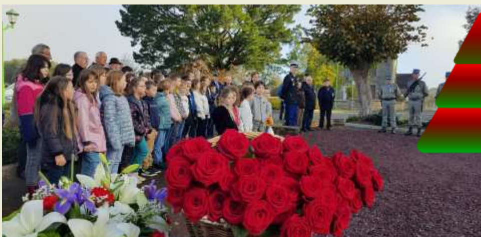
Les écoles présentes à la cérémonie du 11 novembre