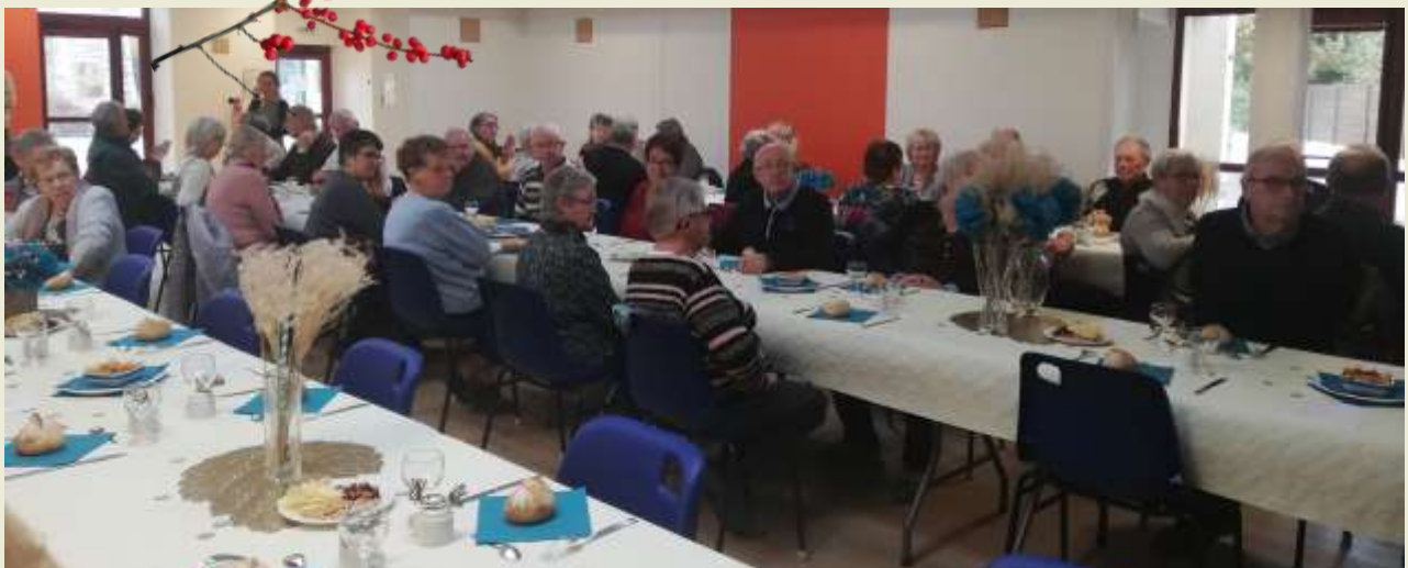
Le repas des aînés