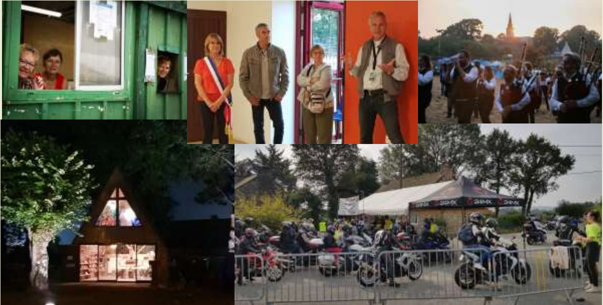
La madone des motards 2022