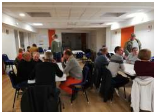
Soirée carte communale