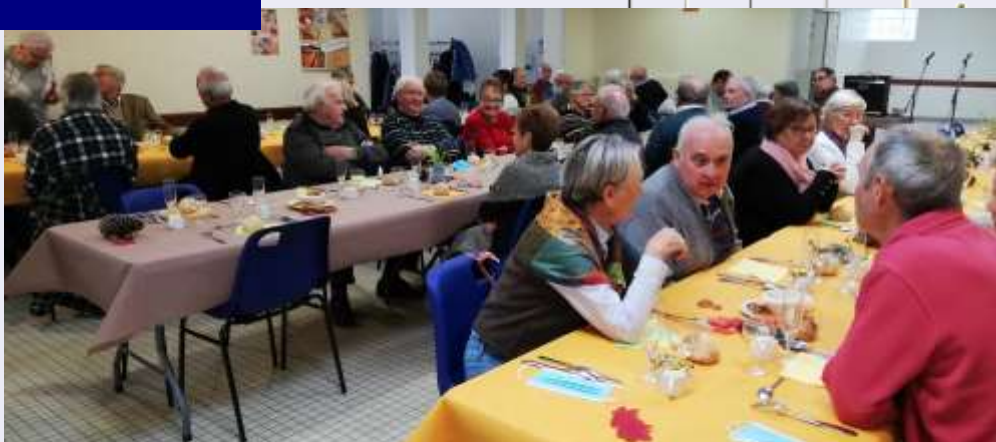
Le repas des aînés