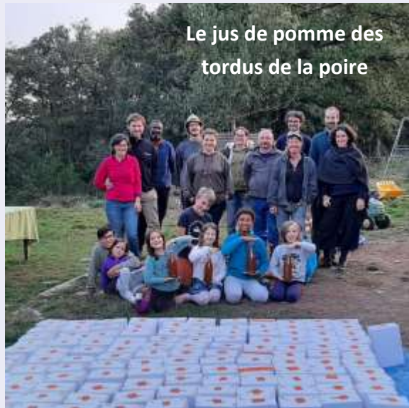
Le jus de pomme des tordus de la poire