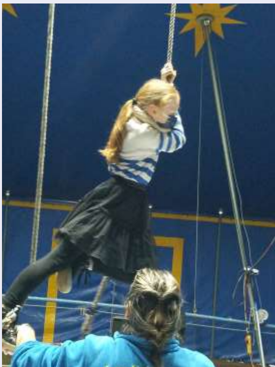
Les écoles Porcaro-Monteneuf