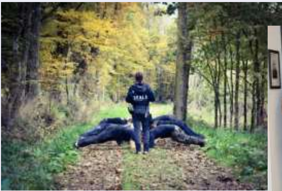
SEALS TEAM Le club buissonnier